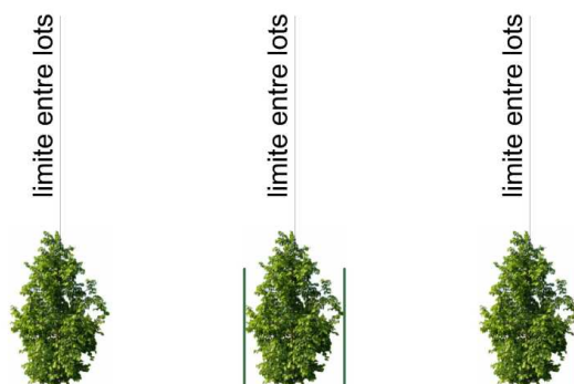
Cas : clôture en limite

3. Le long de la limite Est des lots 1, 2, 3, 4 et 5 et Nord du lot 6, une haie vive d'essence régionale (les conifères et les lauriers sont interdits) doit être créée doublée ou non d'un grillage.