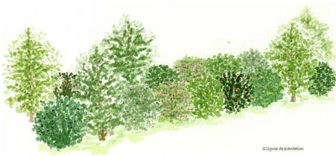
Exemple de haie vive

3. Le long de la limite Est des lots 1, 2, 3, 4 et 5 et Nord du lot 6, une haie vive d'essence régionale (les conifères et les lauriers sont interdits) doit être créée doublée ou non d'un grillage.